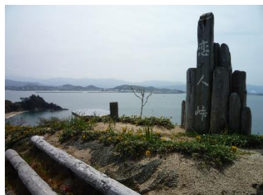
興居島「恋人岬」から松山市街地を一望

家庭菜園や地元の方との交流を楽しみながら、 興居島での移住生活を体験する施設です。 地元の農家からアドバイスをいただけますので、 農作業に不慣れな方でも大丈夫です。