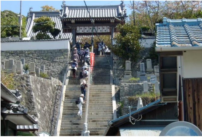
約250年の歴史を持つ 「島四国」

松山市の北西の沖合に浮かぶ、人口約1,100人の島。 由良地区と泊地区の2地区に分かれ、それぞれに港がある。 フェリーは、それぞれの港から約1時間に1本運航。 市内中心部まで約30分で通うことができ、市内への通勤・通学者も多い。 温暖な気候を利用した柑橘栽培が盛ん。 春の「島四国」や秋の「船踊」が有名。 島内に松山市役所興居島支所のほか、こども園、 小中学校、スーパー、診療所などあり。