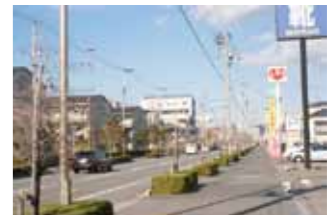
歩道の広い古川はなみずき通り

カフェや飲食店をはじめ、スーパー、パン屋、雑貨屋、学習塾、郵便局や銀行も多く、生活にはとても便利です。また小児科、歯科、動物病院までさまざまな病院も点在。広い歩道が多いため、季節の花や紅葉などを楽しみながら散歩なども楽しめます。市内中心部まで車で所要時間約20分の距離で、自転車で通勤、通学する人も多く見られます。