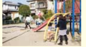
通りの近くには公園も点在している

歩道が広いので、親子で散歩をしながらカフェや買い物をのんびりと楽しむことができます。子どもが大好きなお菓子屋やパン屋が多いのも魅力。近くには南部児童センターがあり、雨の日でも室内で遊ぶことができる。幼稚園などの子育て施設や病院なども多く、子育てファミリーにとっても人気。