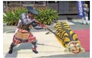
郷土芸能の「虎舞」を披露する住民

宮前地区は松山市の北西部に位置し、近隣には松山空港や、松山の海の玄関口である松山観光港があります。以前は農業を中心としていましたが、近年は住宅街へと移行してきています。地区内にJRと私鉄の駅があり、交通の便が良い地区です。また、スポーツ活動が盛んで、特にグラウンドゴルフのレベルは高いです。郷土芸能や文化財の保存にも力を入れ、地域住民の交流を図っています。