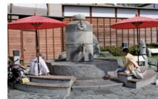
気軽に楽しめる足湯

松山市の東に位置し、道後公園の北にはたくさんの旅館やホテルが立ち並びます。道後温泉周辺には無料で利用できる足湯や手湯が点在し、観光客だけでなく地域住民にも親しまれています。商店街は鯛めしや松山鮓など、松山の郷土料理が味わえる飲食店が充実しています。また、閑静な住宅街には昔から社宅や寮があり、通勤族のまちとしても知られ、転入者が多いため、移住者もなじみやすい地区です。