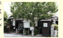
子規の勉強部屋も再現

正宗寺にある子規堂は正岡子規が17歳まで過ごした家を復元し、愛用の机などの遺品や遺墨などが展示されている。「子規の歩いた道」が地区のシンボルで、散策ルートの寺などに句碑が多く立っている。