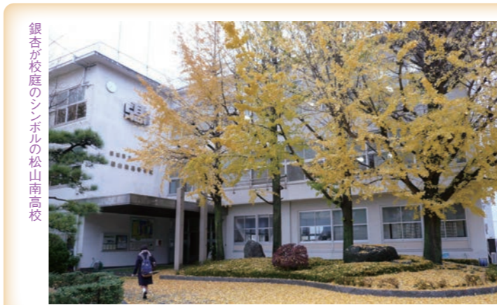
銀杏が校庭のシンボルの松山南高校

人口: 31,877人 世帯: 16,316世帯 10年前との比較 人口: 102.3% 世帯: 110.5%