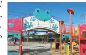
空港東第二公園は遊具も充実

松山空港や、隣接する松前町にある四国最大級のショッピングモールまで車で約10分と、生活に便利です。垣生小学校から徒歩で約10分の所に幼稚園と中学校があります。また、空港近くには公園が多く、子どもやシニアも暮らしやすいエリアです。開発中の分譲地も増加しています。