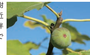
垣生の特産品のイチジク

松山市の西南端に位置する垣生地区は、南は重信川、西は瀬戸内海に面した美しい夕日が見られる風光明媚な地区です。重信川河口は渡り鳥が羽根を休める野鳥の楽園として、バードウォッチングのメッカとなっています。漁業も盛んで、今出で取れるタコは、松山の郷土料理「たこめし」として長く愛されています。また、ブドウ、イチジクなど果樹栽培も盛んで、近年は人口増加に伴う宅地化が進んでいます。