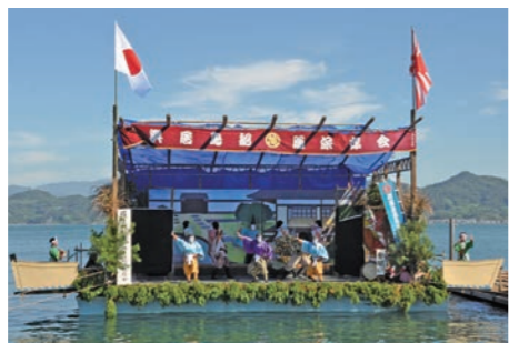
船上舞台上での力強い舞

船越和気比賣神社の秋の祭礼行事のひとつ。毎年10月の第1土曜日に開催され、島内外から多くの観光客が訪れる。船上舞台上で、演者が力強い舞を披露。また、地元中学生による水軍太鼓の演奏もある。