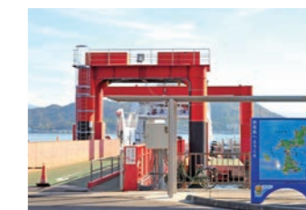
由良港とともに興居島の交通の拠点・泊港

海上交通では、由良港、泊港と高浜港を結ぶフェリーが運航しています。由良港-高浜港間、泊港-高浜港間ともに1日14往復あり、高浜港が伊予鉄道高浜駅と隣接していることから、市内中心部への通勤・通学も可能です。陸上交通は島民が運送する「ごごしまふれあいタクシー」もあります(前日までの予約が必須)。