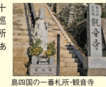
島四国の一番札所・観音寺

約250年の歴史を持つ島遍路で、毎年4月20~21日の2日間にわたって行われる。観音寺を1番札所として出発し、島内八十八ヶ所の札所を巡る。四国八十八ヶ所巡りと同じ利益があるとされている。