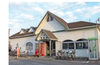
通勤・通学の拠点となる浅海駅

JR予讃線の浅海駅がエリアの中心にあり、普通列車で浅海駅から大型スーパーのある伊予北条駅までは約7分、JR松山駅までは30分～1時間です(発車時刻により異なる)。JR以外はマイカーが中心となります。車を利用の場合、JR浅海駅から市内中心部の松山市役所まで約50分です。また、県内第2の都市・今治市にも隣接しており、JR今治駅へは30分～45分です。