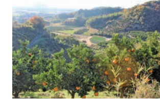
新種のかんきつ類を積極的に栽培している難波地区

松山市の北部に位置し、恵良山や腰折山、新城山といった山々が北に、南には立岩川、西に瀬戸内海が広がる自然に囲まれた地区です。山々の麓から南の立岩川の間には平野が広がり、米や野菜作りが盛んです。特にタマネギは地域の特産品として評判です。ブルーベリーや新種のかんきつ類の栽培も盛んです。東の庄地区は、途絶えていた地域野菜の庄大根栽培を復活させるなど、積極的な試みを行う農家が多い地区です。