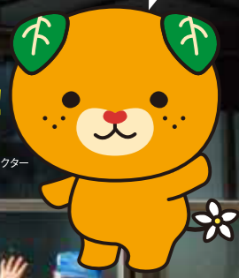
愛媛県 イメージアップキャラクター みきゃん

求人募集中の企業や職業紹介・起業相談の団体も多数参加! 愛媛でのお仕事情報満載です!