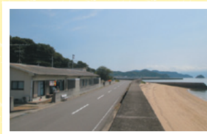
▲左側に見えるのが「神浦定住促進住宅」

忽那諸島は、穏やかな瀬戸内に位置します。島内のいたる所から海が見え、小高い場所からは、瀬戸内の多島美を臨めます。