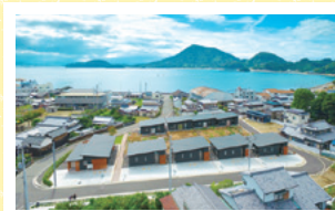
▲交流の会場となる「ハイムインゼルごごしま」

1日目は、H29年4月にオープンしたお試し移住施設「ハイムインゼルごごしま」を見学し、先輩移住者と交流します。2日目も地元の方や先輩移住者と交流会を予定していますので、たっぷり島のハウツーを教えてください!