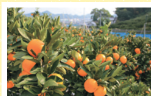
▲12月は、温州みかんの収穫最盛期です。

島しょ部の主要産業は柑橘栽培で、10月～5月まで、様々な柑橘が収穫されます。今回、先輩移住者のみかん畑で、先輩のお話を聞きながら収穫体験ができます。