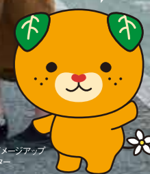
愛媛県イメージアップ キャラクター みきゃん

愛媛県産品が当たる スタンプラリー大抽選会や 蛇口から出る みかんジュースの 試飲体験もできるけん！