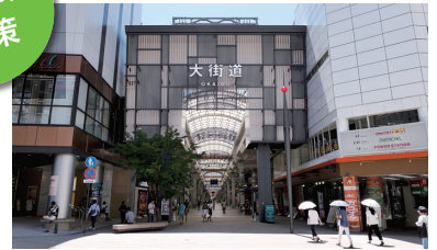
松山市中心部にある大街道商店街

松山市を代表する巨大なアーケード商店街の大街道・銀天街や道後温泉本館と道後温泉駅を結ぶ道後商店街を散策し、松山市の魅力を感じていただけます。もちろん、土産物屋でのショッピングも!