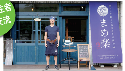
移住者の店主が経営する豆腐の店「まめ楽」

東京から移住された店主が営む豆腐の店で昼食をとりながら、松山市での開業や仕事の様子をイメージしていただけます。