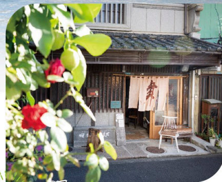
古民家が残る 三津浜の町並み