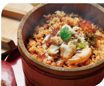
鯛めし 地元グルメを堪能!