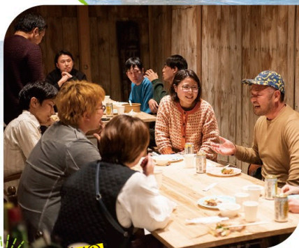
先輩移住者との 交流会