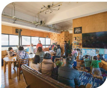
自宅訪問 先輩移住者 生の声!