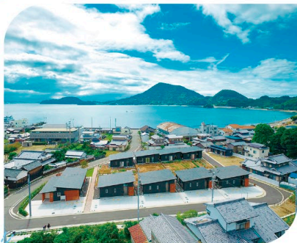
移住促進住宅 ハイムインゼルでごしよと見学